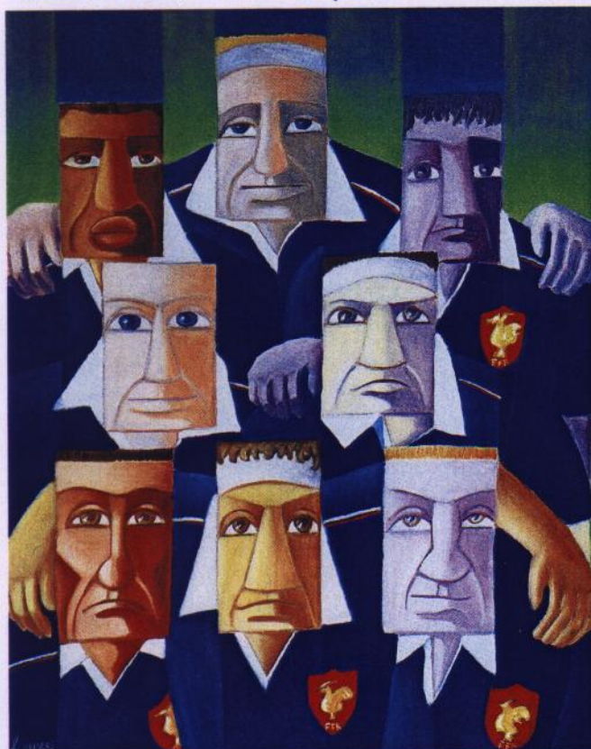
« Ovalie ». Huile sur toile (90 x 70 cm).