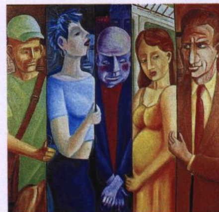
« Promiscuité ». Huile sur toile (100 x 100 cm).